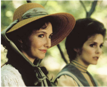
1982 COMÉDIE ÉROTIQUE D'UNE NUIT D'ÉTÉ de Woody Allen avec Julie Hagerty