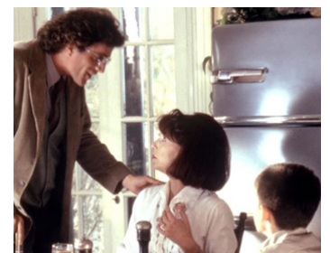
1994 PONTIAC MOON (Pontiac Moon) de Peter Medak avec Ted Danson