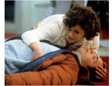
1985 UN DRÔLE DE NOËL (One Magic Christmas) de Phillip Borsos avec Gary Basaraba