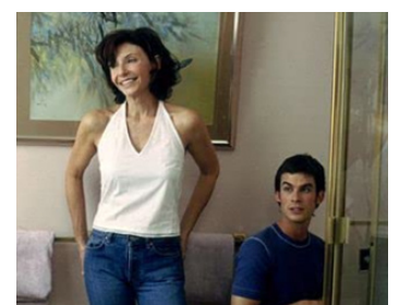
2001 LA MAISON SUR L'OcéAN (Life as a House) d'Irwin Winkler avec Ian Somerhalder