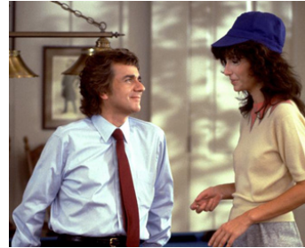
1983 LA FILLE SUR LA BANQUETTE ARRIÈRE (Romantic Comedy) d'A. Hiller avec D. Moore