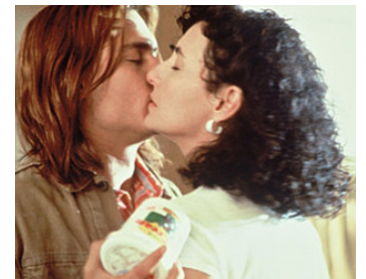
1993 GILBERT GRAPE (What's eating Gilbert Grape) de Lasse Hallström avec Johnny Depp