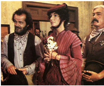
1978 EN ROUTE VERS LE SUD (Goin' South) de et avec Jack Nicholson, Richard Bradford