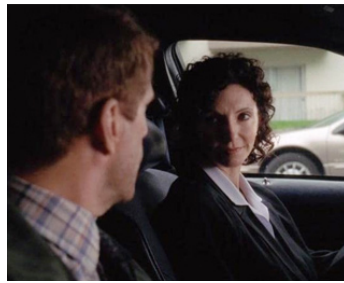
2002 LA PORTE DE L'AU-DELÀ (Living with the Dead) de Stephen Gyllenhaal avec Ted Danson