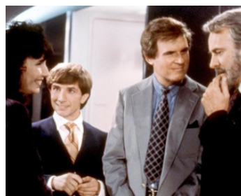
1994 CLIFFORD (Clifford) de Paul Flaherty avec Martin Short, Ch. Grodin, Dawney Coleman