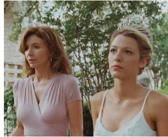
2007 ELVIS ET ANNABELLE (Elvis & Anabelle) de Will Geiger avec Blake Lively