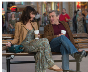
2013 LAST VEGAS (Last Vegas) de Jon Turteltaub avec Robert De Niro