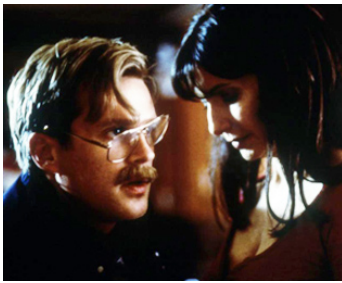
2001 WISH YOU WERE DEAD de Valerie McCaffrey avec Cary Elwes