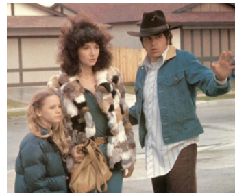
1980 MELVIN ET HOWARD (Melvin and Howard) de Jonathan Demme avec Paul Le Matt