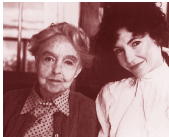
1987 LES BALEINES DU MOIS D'AOUT (The Whales of August) de Lindsay Anderson avec Lillian Gish