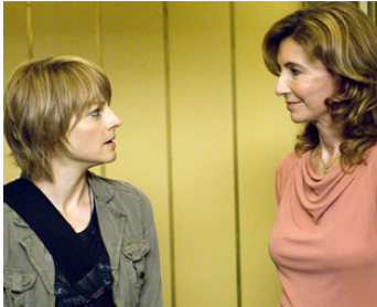
2007 À VIF (The Brave One) de Neil Jordan avec Jodie Foster