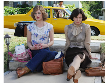
2010 DIRTY GIRL (Dirty Girl) d'Abe Sylvia avec Milla Jovovich