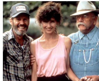
1987 END OF THE LINE de Jay Russell avec Levon Helm, Wilford Brimley