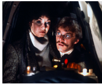
1979 C'ÉTAIT DEMAIN (Time after Time) de Nicholas Meyer avec Malcolm McDowell