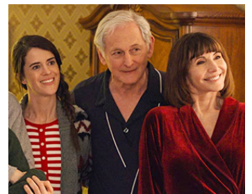
2020 MA BELLE FAMILLE, NOËL ET MOI (Happiest Season) de C. DuVall avec K. Stewart, V. Gabler