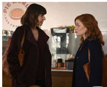
2017 I DO... UNTIL I DON'T de Lake Bell avec Amber Heard