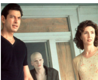
1995 POWDER (Powder) de Victor Salva avec Jeff Goldblum, Sean Patrick Flanery