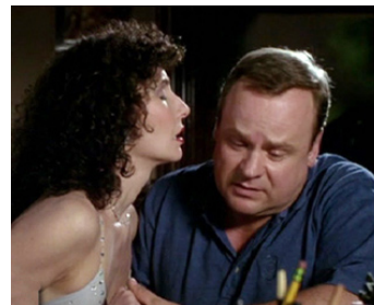
1991 LA FEMME DU BOUCHER (The Butcher's Wife) de Terry Hughes avec George Dzundza