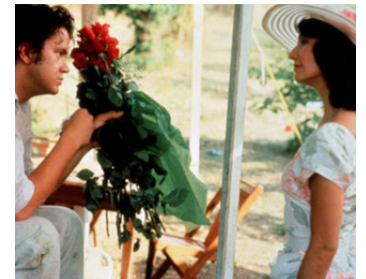
1989 MISS FIRECRACKER de Thomas Schlamme avec Tim Robbins