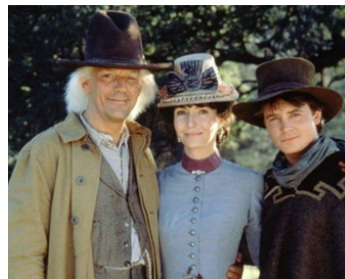
1990 RETOUR VERS LE FUTUR 3 de Robert Zemeckis avec Ch. Lloyd, Michael J. Fox