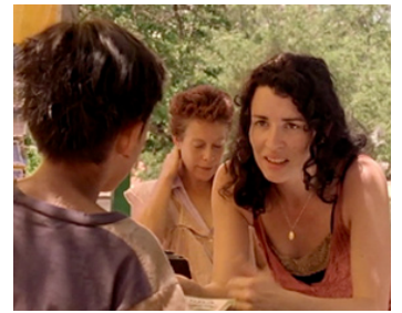
2003 CASA DE LOS BABYS de John Sayles avec Ignacio de Anda, Angelina Pelaez