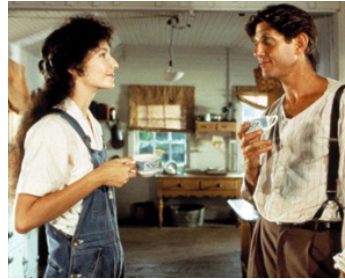
1983 CROSS CREEK (Marjorie) de Martin Ritt avec Peter Coyote