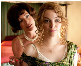
2011 LA COULEUR DES SENTIMENTS (The Help) de Tate Taylor avec Emma Stone