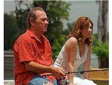
2009 DANS LA BRUME ÉLECTRIQUE (In the Electric Mist) de B. Tavernier avec Tommy Lee Jones