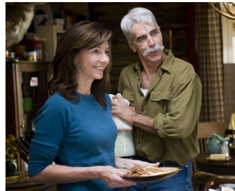
2009 OÙ SONT PASSÉS LES MORGAN (Did you hear about the Morgans?) de M. Lawrence avec S. Elliott