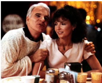
1989 PORTRAIT CRACHÉ D'UNE FAMILLE MODÈLE (Parenthood) de Ron Howard avec Steve Martin