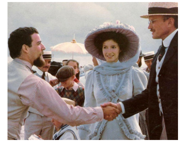
1981 RAGTIME (Ragtime) de Milos Forman avec Mandy Patinkin, James Olson