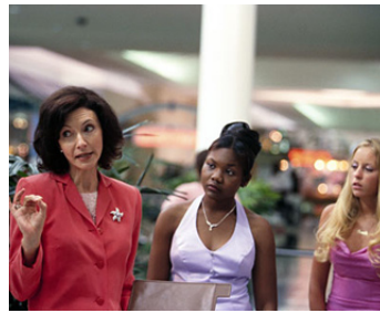
2002 SUNSHINE STATE (Sunshine State) de John Sayles avec Amanda Wing