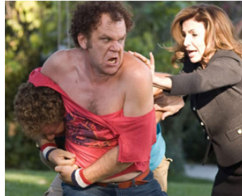
2008 FRANGINS MALGRÉ EUX (Step Brothers) d'Adam McKay avec Will Ferrell, John C. Reilly