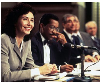
1993 PHILADELPHIA (Philadelphia) de Jonathan Demme avec Obba Babatundé